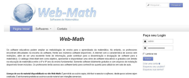
Figura 2. Interface do catálogo Web-Math .

Por meio da opção “Login”, o professor-usuário acessa sua área restrita a partir de um login e senha. Se o professor-usuário for novato, é possível realizar o cadastro por meio da opção “Criar uma conta”. Ao acessá-la, alguns dados pessoais como nome completo, nome que adotará como usuário, e-mail e senha são requisitados ao professor-usuário (Figura 3).